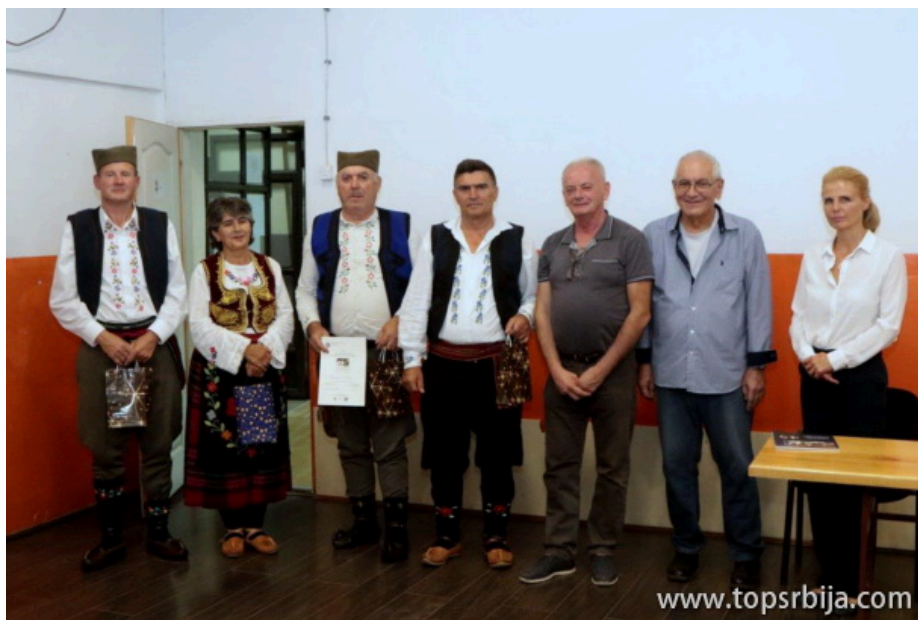
ZAJEDNIČKI SNIMAK UČESNIKA RADIONICE U VILI