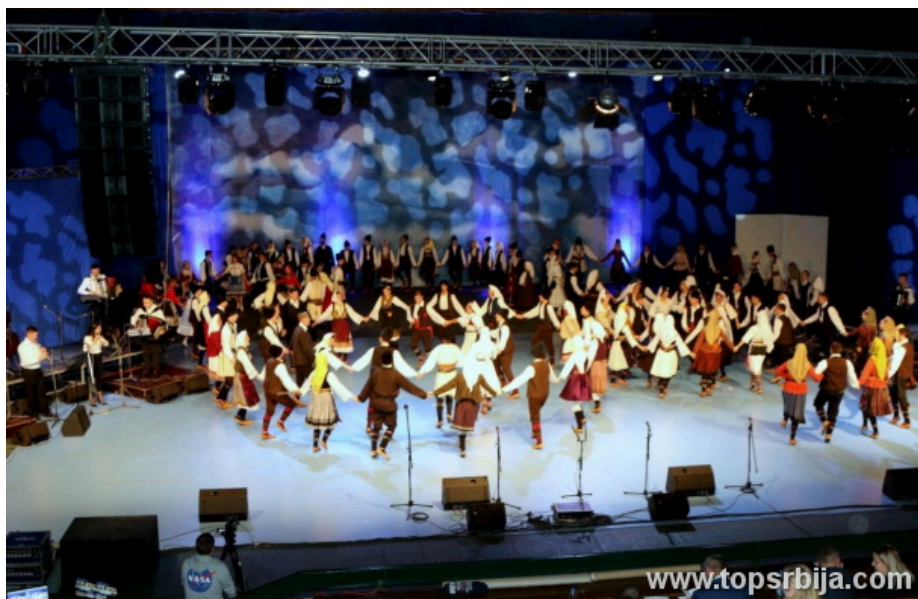
AFIRMACIJA TRADICIJE NARODA SA OVIH PROSTORA