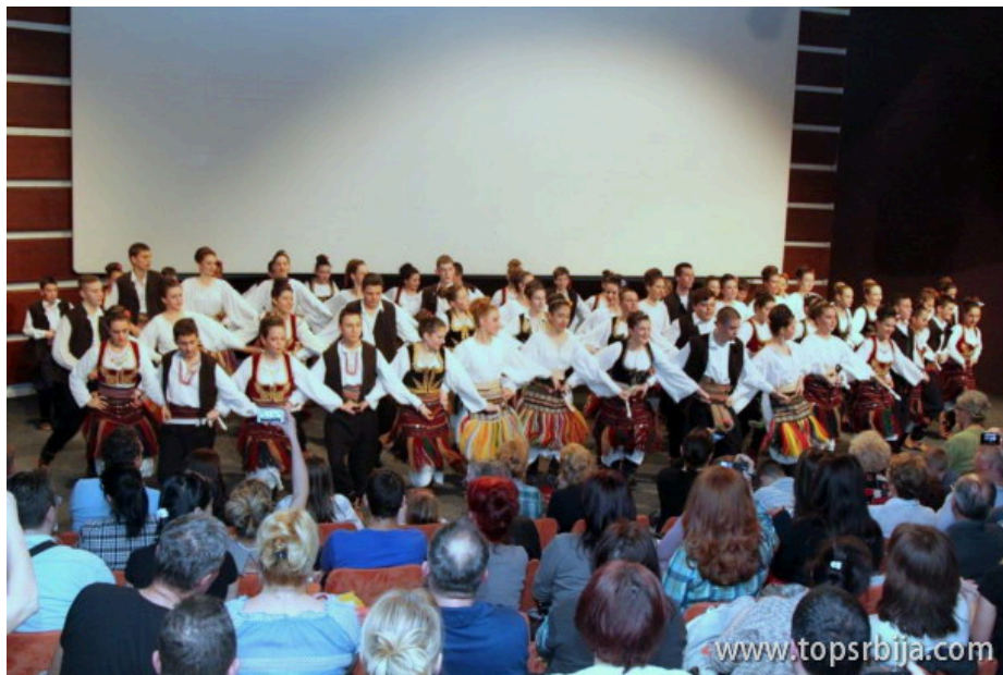
PUNA PODRŠKA AKCIJI MI SMO KULTURA I NASLEĐE SRBIJE 07. OKTOBRA

Ministarstvo kulture i informisanja Republike Srbije pokrenulo javnu raspravu o "Strategiji razvoja kulture Republike Srbije za period od 2017. do 2027. godine". Rasprava traje do 28. septembra 2017. godine. Govoreći tokom javne rasprave ministar kulture Vladan Vukosavljević je istakao da je neophodno da se značajno povećaju izdavanja za kulturu. Naglasio je da će naša nacionalna kultura, a samim tim i kulturno umetnička društva i tzv. amaterizam zauzeti izuzetno značajno mesto.