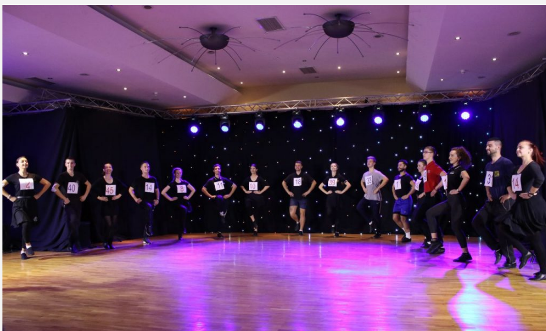
Nadmetanje „Zaigrajte noge moje, pa da vidim bolji ko je“ u okviru manifestacije „Svetski dan srpskog kola“, 2020

Uprkos neizvesnosti, uzrokovane situacijom pandemije Kovida 19, na oduševljenje svih prisutnih, ipak je četvrti put proslavljen Svetski dan srpskog kola . Manifestacija, čiji je cilj