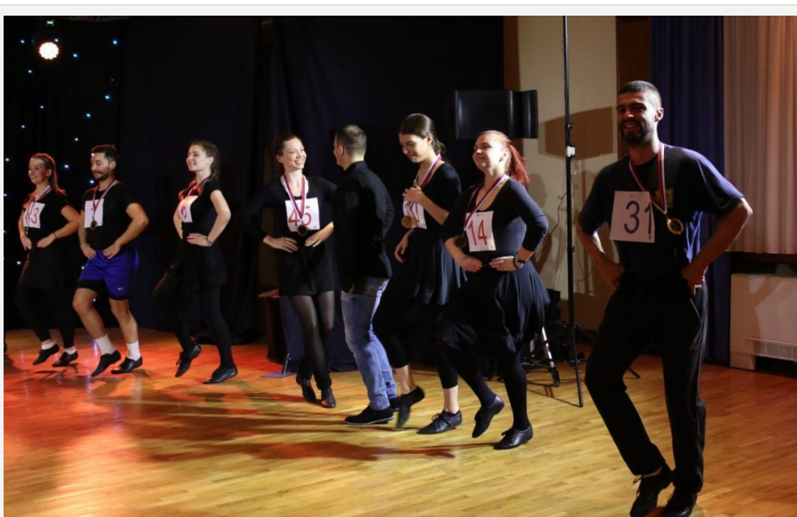
Nadmetanje „Zaigrajte noge moje, pa da vidim bolji ko je” u okviru manifestacije „Svetski dan srpskog kola”, 2020

Takmičenje je, prema broju učesnika, organizovano u dva kruga, od kojih je prvi bio eliminacioni . To, međutim, nije sprečilo plesače da se dobro zabave, upoznaju i razmene iskustva. Iako publika u maloj sali hotela „Norcev” zbog preventivnih mera nije bila brojna, takmičari koji su čekali na svoj nastup imali su priliku da prate izvođenje ostalih učesnika putem TV ekrana u predvorju i da tako navijaju i bodre svoje saigrače.